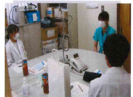
新人薬剤師からのお話