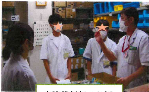
病院薬剤師のお話

8月10日、鶴岡協立病院と鶴岡ひまわり薬局合同で高校生薬剤師体験を開催しました。今回は4名の高校生の参加があり、病院・薬局薬剤師の仕事を体験しました。将来の目標選択のお役に立てたようで大変うれしく思いました。