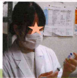
注射薬の配合変化体験